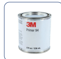
PRIMER 3M P94

LA GARANZIA NON COPRE L'INSTALLAZIONE DEL PRODOTTO, NÈ COPRE L'ADESIONE DEL PRODOTTO ALLA BARCA O SU QUALSIASI ALTRA SUPERFICIE. VEDI CONTRATTO DI VENDITA.