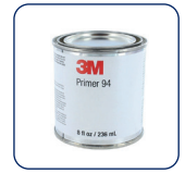
PRIMER 3M P94 (consigliato)