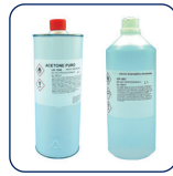
ACETONE o ALCOOL ISOPROPILICO